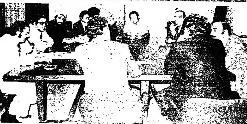
لجنة النهضة اثناء اجتماعها في مقر المجلس الاسلامي الشيعي امس